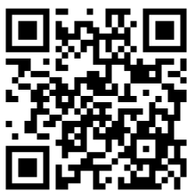
木の実幼稚園 プレ保育（就園前保育）