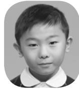
いで ゆうすけ (けいさつかん)