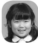
みよし ちひろ (ケーキやさん)