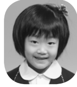
はまもと きっか (ケーキやさん)