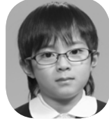
くつな かいと (おわらいげいじん)