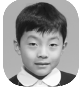
しもほう こうだい (おもちゃをつくるひと)