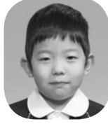
すえもと えいしん (こうばんのおまわりさん)