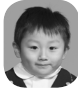
やまもと ゆきみ (F1レーサー)