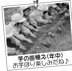
芋の苗植え(年中) お芋ほし楽しみだね♪