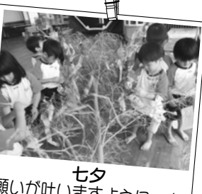
七夕 願いが叶いますように…☆