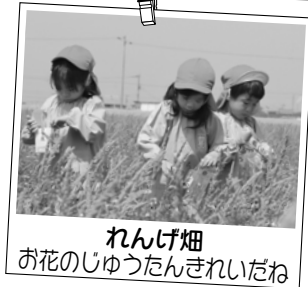
れんげ畑 お花のじゅつたんきれいだね