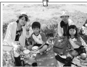
親子遠足 お弁当おいしかったね