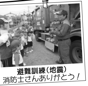
避難訓練(地震) 消防士さんありがとう!