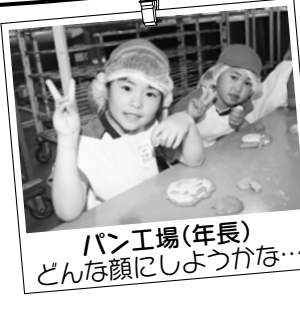
パン工場(年長) どんな顔にしようかな…