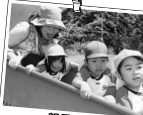
親子遠足 楽しい遊具がたくさんあったよ