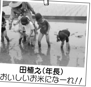
田植え(年長) おいしいお米になーれ!!