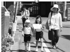
ウォークラリー 垣生の町をたんけんだ!