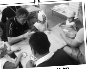
ファミリー参観 なかなか上手にできたぞ