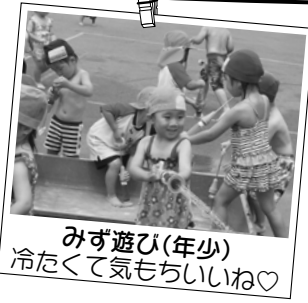
みず遊び(年少) 冷たくて気持ちいいね♡