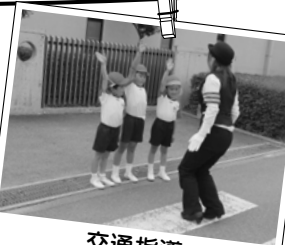
交通指導 手をあげてわらう!!