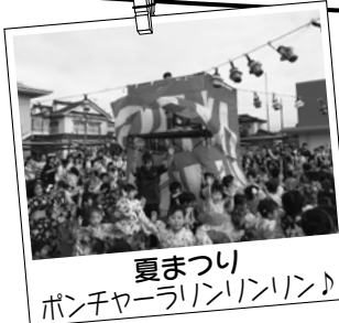
夏まつり ポンチャーランリンリン♪