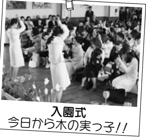
入園式 今日から木の実っ子!!