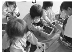
あさがお種まき(年中) 何色の花が咲くかな…