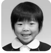
いしい そうたつ (ユーチューバー)