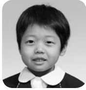
くろだ そう (けいさつかん)