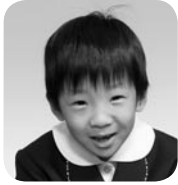
おち りくと (ごはんやさん)