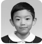
つた ゆうしん (きょうりゅうはかせ)