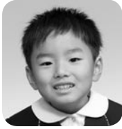
はまくち しゅうや (ユーチューバー)