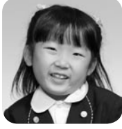
おだに りお (アイドル)