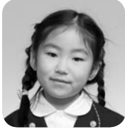
せきや こまり (けいさつかん)