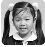
まつおか むむ (ケーキやさん)