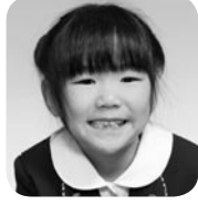
わらび ほのか (ケーキやさん)