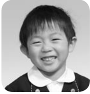
やまくち そうすけ (ユーチューバー)