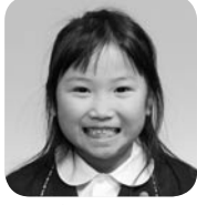
みずもと さな (ボクサー)