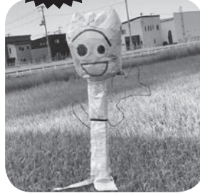
ふぉーキーかかし