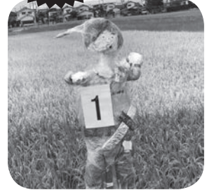
ぴーたーぼんかかし