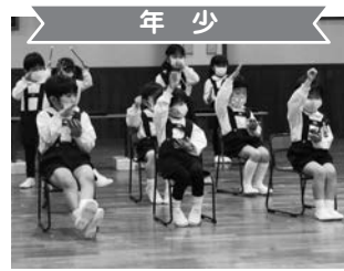
年少 合奏「こぎつね」