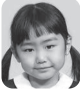
こうの ゆいこ (アイドル)