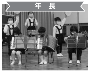
年長 合奏「木の实幼稚園の歌」