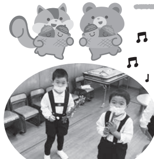
年少<ブロック遊び>