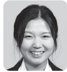
とい ゆうり せんせい