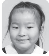
むろの ののは (せんせい)