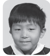
たにもと わたる (ユーチューバー)