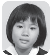
やまうち いろは (はいしゃさん)