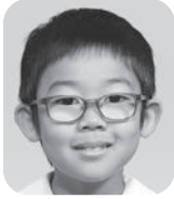
はぎの やまと (けいさつかん)