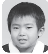
たなか ほまれ (けいさつかん)