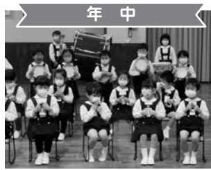
年中 合奏「森のくまさん」