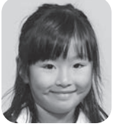
まつもと こなつ (ペットショップヤさん)