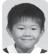
うつのみや はるき (でんしゃのうんてんしゅ)