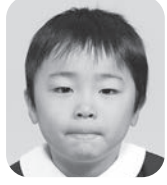
いしまる はやと (ボクシングせんしゅ)