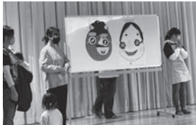
先生方を巻き込んでの福笑い

今回も楽しいお話を聞かせてくれました。このみったちの笑顔がたくさん見られました。