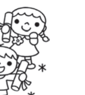
まつふじ こころ (コーヒーやさん)