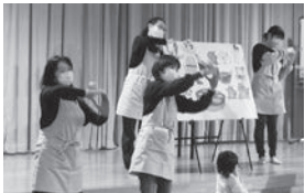
みんなで手遊びをしたよ!