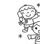
はらだ あいる (びょうし)