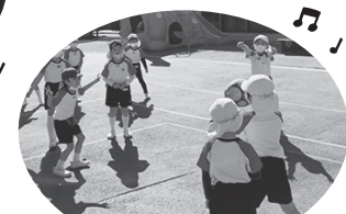
年長<ドッジボール>