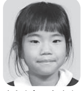
むらもと わかな (ピアニスト)