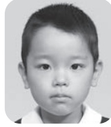
おがさわら はる (ピアニスト)