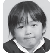
たかた あきつく (けいさつかん)