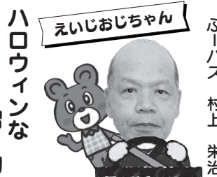
えいじおじちゃん ハロウィンな贈り物

伊予農業高等学校の学生たちが、収穫した「ごて力ポチャ」を持ってきてくださいました。子どもたちはその大きさにびっくり。大喜びでした。素敵な贈り物をありがとうございました!