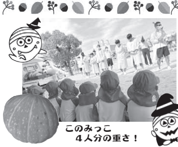
このみっこ 4人分の重さ!

このみっこになっていろいろなことに少しずつ挑戦するようになりました。人見知りでも上手に言葉に出来なかったこともちゃんと伝えられるようになり、たくさんのお友達と遊んだり、作ってきたよ!と製作したものを家で姉や弟と遊んだり!いつも笑顔で元気いっぱいです☆身体を動かすことが大好きなので年長さんになったらサッカーがしてみたいです。これからも頑張りたいたいことに挑戦してほしいです!