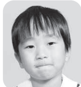
おかだ えいと (バハマたいなかつこいひと)