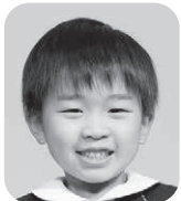
おかやま あさひ (おすしやさん)