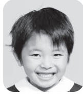
かん しょうよう (けいさつかん)