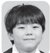
かね これい (アイスやさん)