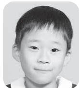
くぼ わく (けいさつかん)