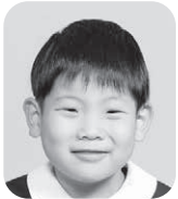
うえだ がく (ユーチューバー)