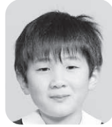
かじ ともはる (ユーチューバー)