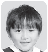
あんど うりょうま (サッカーせんしゅ)