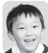
きくち しょうま (ユーチューバー)