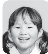
しのざき えま (がっこうのせんせい)