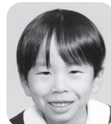
やの みなと (サッカーせんしゅ)