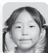
おかざき ゆあ (ユーチューバー)