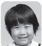
もりばやし みなと (けいさつかん)