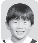
ながお そら (けいさつかん)