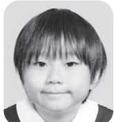
にしぞの はる (しょうぼうし)