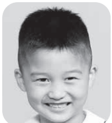
ふなはし つかさ (ラーメンやさん)