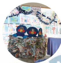
年中さんのお部屋