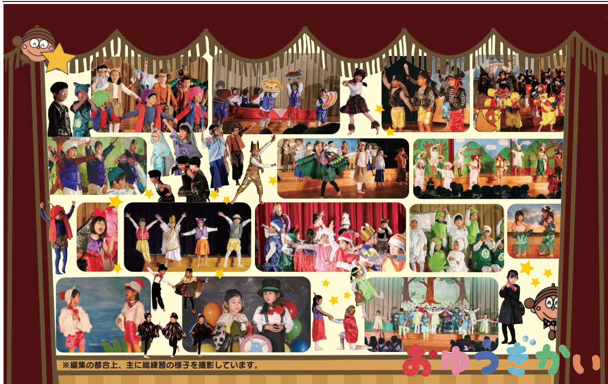
※編集の都合上、主に総練習の様子を撮影しています。