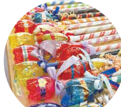
文化部さんの 手芸品販売