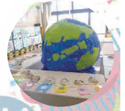
年長さんのお部屋