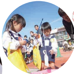
おかしつり おもちゃくじ