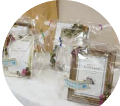
手芸サークルさんの 作品販売