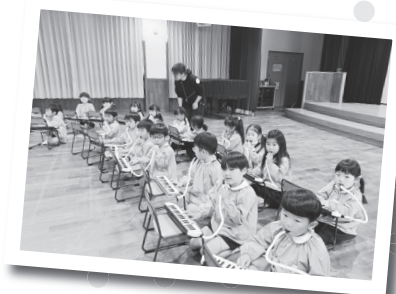
わくわくミュージック