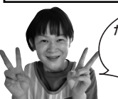
たまご・ひよこフリー くもん 公文 なみ 圭美