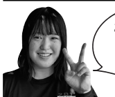
このみホーム まつかほ 増金 わかさ 若菜