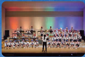
ふじ・たんぽぽ・ひまわり(合奏)ドレミの歌