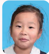
しのみや めい (かめらまん)