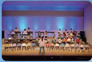
れんげ・つばき(合奏)子どもの世界