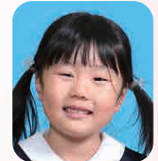
たかた あすか (おいしゃさん)