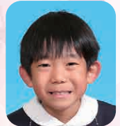
ながせ まさき (かせきをはつつするひと)