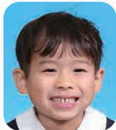
つらはら あお (ゆーちゅーぼー)