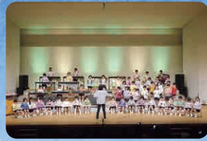
すみれ・ゆり・ひまわり(合奏)世界中の子どもたちが

平成31年度の音楽会から4年ぶりに木の実音楽会が返ってきました！今年のテーマは「おととおそぼう」初めての太舞台に少し緊張した表情で舞台上がった園児達。音楽が流れると今までの練習の成果を発揮し、笑顔で歌や演奏を披露し大成功の音楽発表会となりました。