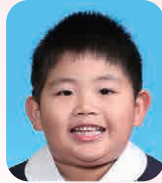
なかや そうじん (うちゅうひごうし)