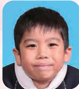
せきな が はると (ゆーちゆーばー)