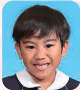
かわくぼ くらすけ (おとうさんとおなじおしごと)