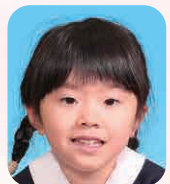
ごとう めい (ういっしゅのうたをうたがしゅ)