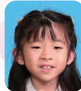
うつのみや さつき (ふあっしょんでざいなー)