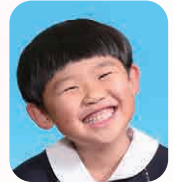
たにみず あくあ (ゆーちゅーばー)