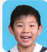
みやわき ごう (けいさつかん)