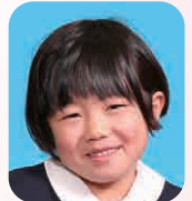
ただ ももは (ほいくし)