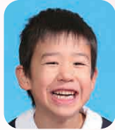
にえとくた りゅうぜん (けいさつかん)