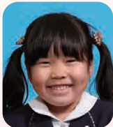
ほしが さな (あいどる)