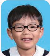
にゆうのや ゆうしん (ばすけのおりんびっくせんしゅ)