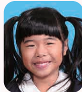
おだ ことは (おはなやさん)