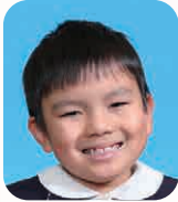
ひょうどう たくみ (ゆーちゅーぼー)