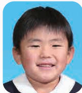
さかいり けいしょう (さっかーせんしゅ)