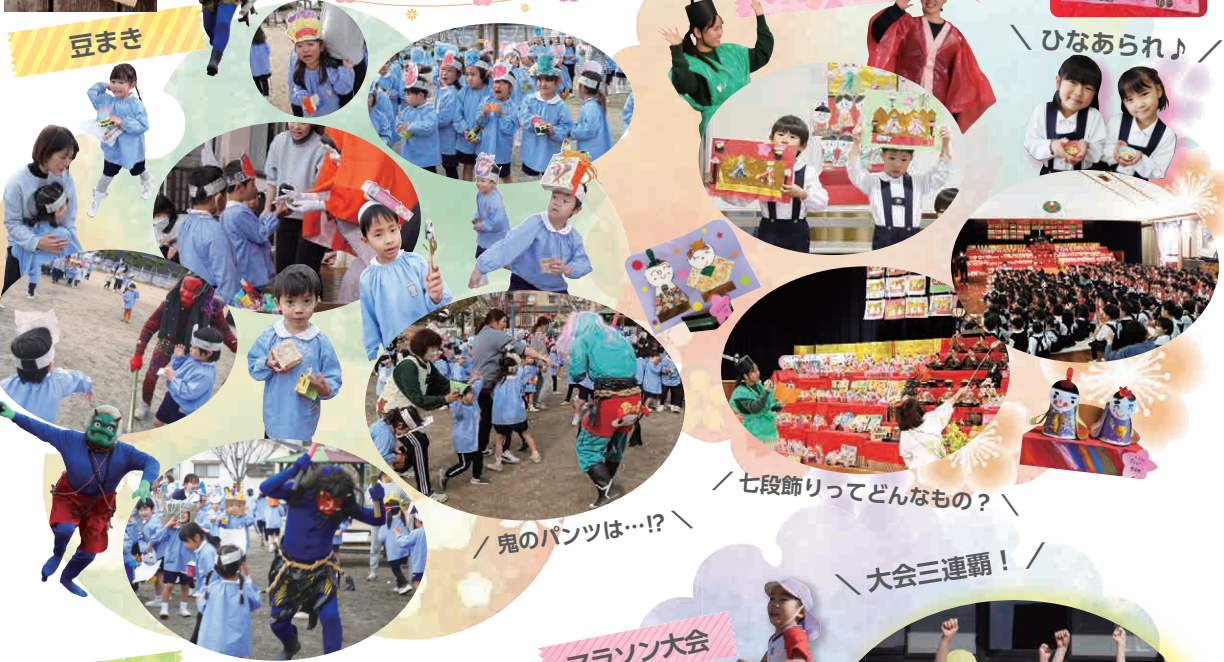
七段飾りってどんなもの？