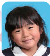
はなたに さくら (おようふくやさん)