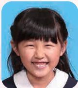
なかにし とうこ (あいどる)