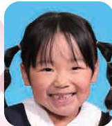
にしたに うた (あいどる)