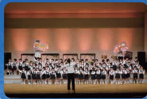
年少児(合唱)ちようちよ・アイアイ・どんぐりころころ (合奏)おもちゃのチャチャチャ