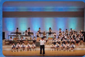
きく・さくら(合奏)さんぽ