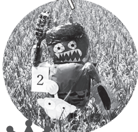
1 381票 おにぞんぴ かかし (ふじ・すみれ)