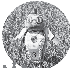
3 254票 ひかきんへび きらきらかかし (さくら・つばき)