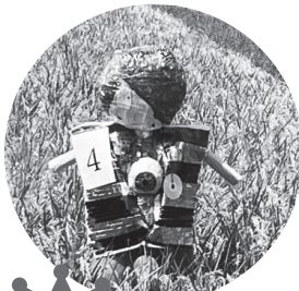
2 234票 きたろうと めだまおやしにかかし (きく・つばき)