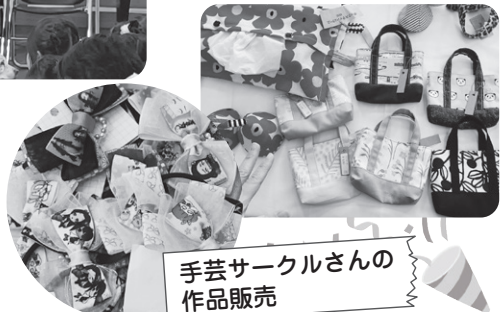
手芸サークルさんの 作品販売