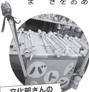
文化部さんの 手芸品販売