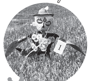
4 210票 のろいののろい かかし (たんぼぼ・ゆり)